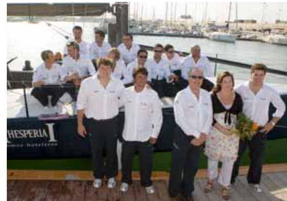
S.A.R Princesa Alexia de Grecia madrina de la embarcación