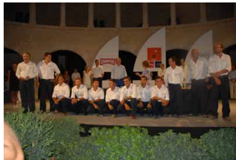
2º Lugar Copa del Rey 2007